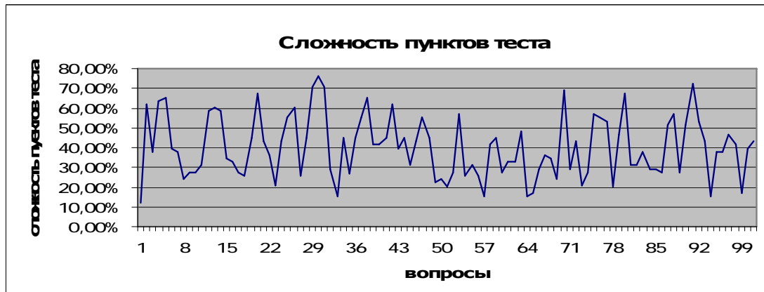
Рис. 2 – Уровни сложности пунктов теста

назначения теста. Решение о трудности заданий нельзя принимать шаблонно, без учёта того, как предполагается использовать тестовые показатели [1]. То есть, недостаточная сложность пунктов теста по этим вопросам объясняется тем, что положительный ответ на данные вопросы, могут дать люди с чрезвычайно тонкими границами. Уровни сложности пунктов теста представлены ниже на графике.