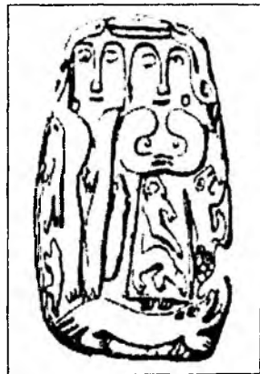
Рис.1. Плакетки с изображением "мамонта" в нижнем ярусе.

иконографические критерии дифференциации изображений, можно сделать вывод, что название «ящер» условное, так как выделяются две самостоятельные группы изображений: образ мамонта и мифической ящерицы - «йура».